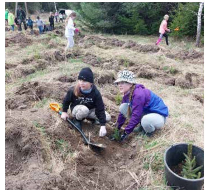
Väikesed metsaistutajad – maailmapäästjad.