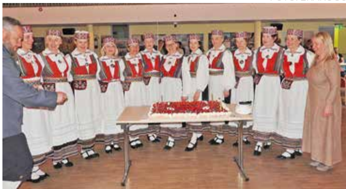
Kirilinnu tantsijad koos juhendajaga ja nende juubelitort.