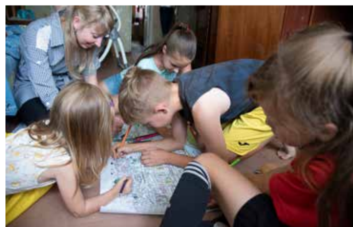
Lasteküla tegevuse abil muutub nii mõnegi pisipõnni päev märksa helgemaks ja toob naeru näole.

Ka näiteks kodus sooja toidu tegemine võib olla paljudele proovikivi – kui emal-isal endal pole olnud häid eeskujusid, kellelt õppida, kuidas pere toimib, siis üldjuhul ei oska need vanemad ka oma lapsi suunata ega vajalikke peret-suunata.