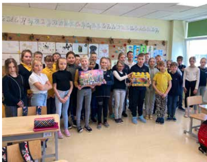
2.a ja 2.b klass kingitust kätte saamas.

See kõik sai teoks 12. mail Kose gümnaasiumi algkooli