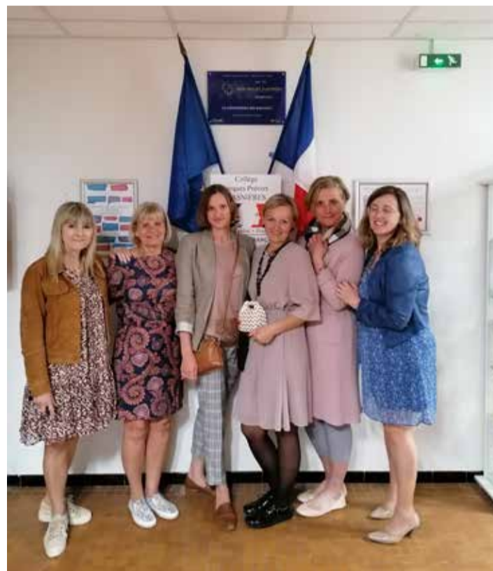
Prantsusmaal õpirändel käinud Kose-Uuemõisa lasteaed-kooli seltskond.

Klassiõpetaja viib ise läbi kõik tunnid, ka kehalise, muusika ja inglise keele. Iga päev on kohustuslik vähemalt 15 minutit lugeda, reegel keh- tib ka õpetajale. Õppetöö