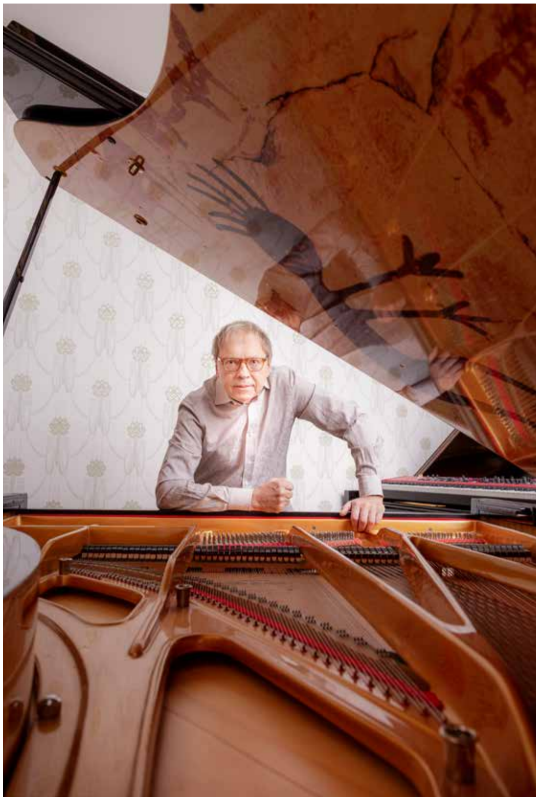
Rein Rannap toob klaveri pärast tosinkonna aasta pikkust vaheaega taas külla. Muuhulgas annab ta kontserdi ka Kose kirikus, seda juba 7. juunil.

Üllatus on ka ühe klaveri ettevalmistamine keelte vahele asetatud esemetega, mis klaveri kõla tundmatuseni muudab – nüüd kuuleme