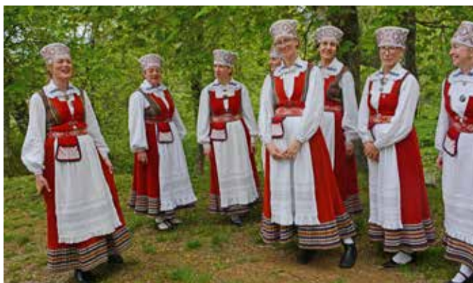
Soojendusharjutusi teevad Kose-Uuemõisa naisrühma tantsijad.