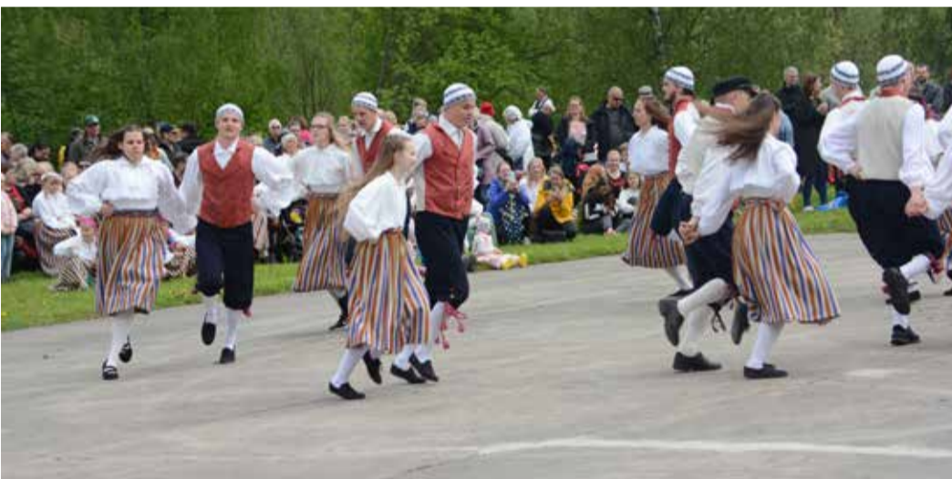
Rõõmsat tantsulusti jagus terveks pikaks päevaks.