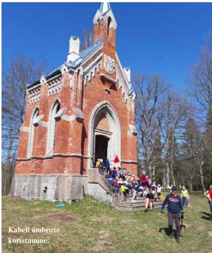
Kabeli ümbruse koristamine.

Tore oli vaadata korras ümbrust. Loodame, et puhas ja ilus Kabelimägi kutsub kõiki oma kodukohta hoidma ja meile jäetud kultuuripärandi üle uhkust tundma. ↓